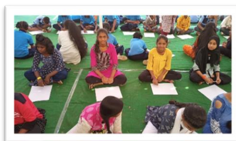
DRAWING & PAINTING