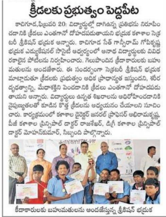
MAF - Kabaddi 1 st prize