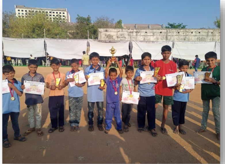
MAF – Running & Lemon Spoon winners