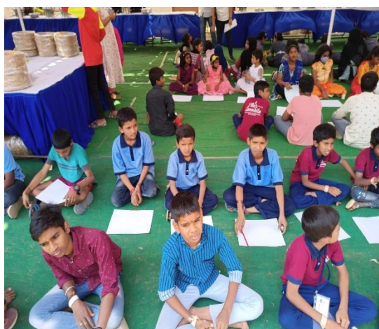
ESSAY WRITING COMPETITION